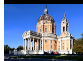
Basilica di Superga