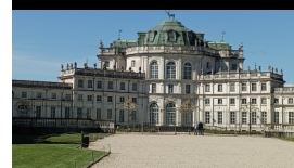
Château de Stupinigi