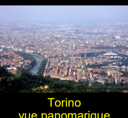
Torino vue panoramique