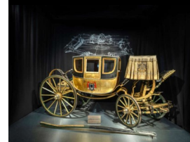
Carrosse de Napoléon