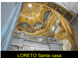
LORETO Santa casa