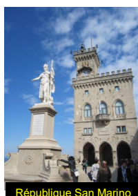
République San Marino