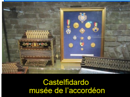
Castelfidardo musée de l'accordéon