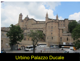
Urbino Palazzo Ducale