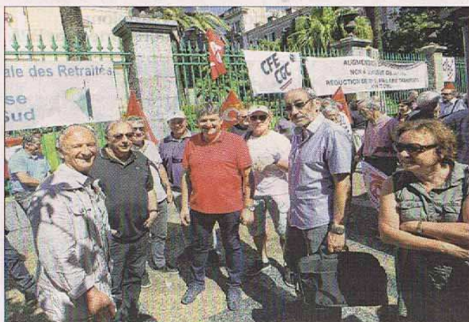
Pour la troisième fois depuis le début de l'année, les retraités insulaires ont haussé le ton et se sont rassemblés hier matin devant la préfecture d'Ajaccio.

Le 14 juin 2018, L'ANR était présente à Bastia et à Ajaccio. A l'appel de 9 organisations, les retraités ont manifesté notamment sur le pouvoir d'achat des retraités et contre un contexte économique et social insulaire qui se dégrade.