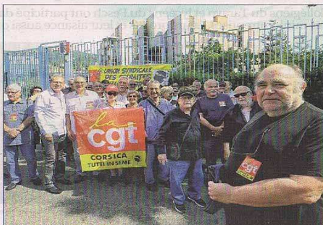
Un peu moins de 50 personnes ont répondu à l'appel de l'intersyndicale devant la préfecture d'Haute-Corse.

A ugmentation des pensions. Non à la hausse de la CSG. Réduction de 50% du prix des transports pour tous. Retraités tous concernés. Rispatatti l'anziani! Voilà pour les mots d'ordre sur les banderoles et les tracts. Pour la troisième fois depuis le début de l'année, les retraités insulaires ont haussé le ton et se sont rassemblés hier matin à 10 heures devant la préfecture d'Ajaccio. L'appel à la mobilisation avait été lancé par la CGT, l'union confédérale des retraités (UCR), FO, l'Unsa, la CFTC, la FSU, la CFE-CGC, les retraités de la fonction publique et l'association nationale des retraités de La Poste et Orange. C'est ainsi que les retraités corses ont emboîté le pas à leurs homologues continentaux.